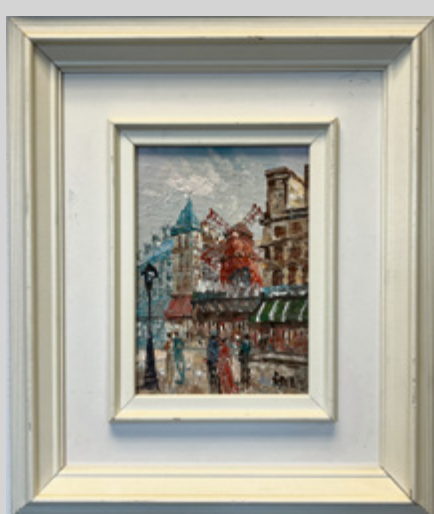
CAROLINE BURNETT Moulin Rouge, huile sur toile, 19 e siècle, impressionniste 5" x 7". 150 $