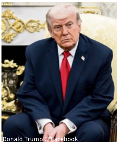
Donald Trump

Le Président américain lui-même en est d'ailleurs un exemple parfait à tous les niveaux. Sans arrêt, il tente de déformer la réalité à son image, pour satisfaire ses ambitions totalitaires et égocentrées. Il utilise à l'extrême le mensonge, la désinformation massive, propageant sur ses réseaux sociaux la moindre fausse nouvelle qui paraît l'avantager/l'encenser et/ou qui insulte/critique/rabaisse ses adversaires et opposants. Constamment, il s'invente des réalisations factices, s'attribue des succès dont il n'est nullement responsable et attaque au vitriol médiatique quiconque ose contester sa suprême grandeur auto-proclamée.