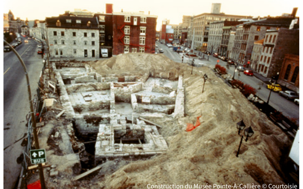
Construction du Musée Pointe-à-Callière

Grâce à sa vision, son amour de Montréal, son sens de l'histoire et son leadership, Jean Doré a permis de conserver et de mettre en valeur le lieu de naissance de Montréal et les premières traces des habitants, mais également de léguer, avec ses partenaires, ce patrimoine pour les générations à venir. ■