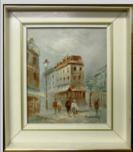
CAROLINE BURNETT Scène de Paris, huile sur toile, 19 e siècle, impressionniste, 8" x 10". 200 $