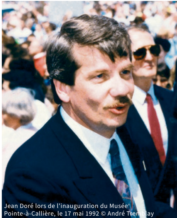
Jean Doré lors de l'inauguration du Musée Pointe-à-Callière, le 17 mai 1992

Né en décembre 1944, avocat de formation, Jean Doré fut maire de Montréal de 1986 à 1994. Après avoir été dans un premier temps battu en 1982 par un Maire Drapeau en route vers son 8 e et dernier mandat avant la retraite, c'est Jean Doré, en tant que chef du RCM (Rassemblement des Citoyens de Montréal) qui sera le premier à lui succéder en novembre 1986, avant d'être réélu pour un 2 e mandat en 1990.