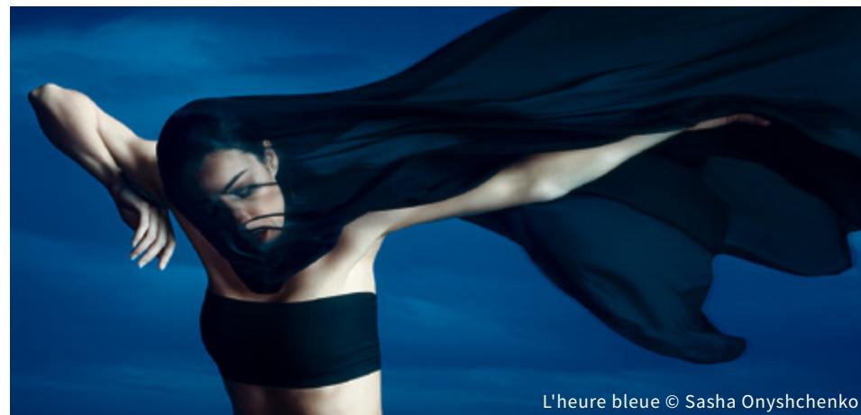
L'heure bleue

Quelques jours plus tôt, le ballet et la danse contemporaine auront été mis en lumière durant la présentation de L'Heure Bleue des Grands ballets canadiens de Montréal ( Théâtre Maisonneuve , 23 au 26 avril). En terminant, parlons de la version théâtrale du Crime de l'Orient Express qui sera présentée au Théâtre Maisonneuve le 30 avril prochain. ■