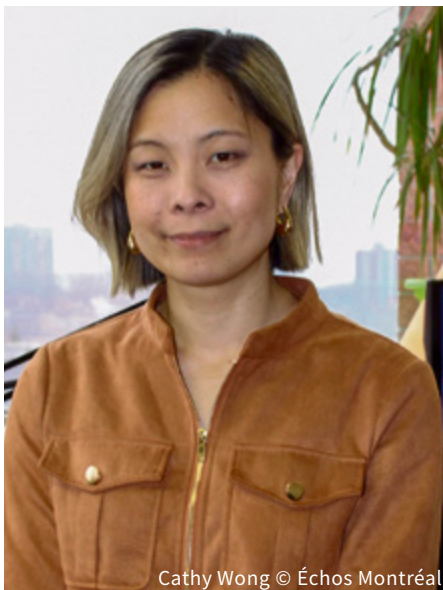
Cathy Wong

C'est sûr qu'on veut que le Plateau demeure un quartier où on peut accueillir des familles, avec des logements abordables et des services. Alors, on accompagne des projets de logement, mais aussi culturels, sociaux et communautaires, qui nous tiennent à cœur. Il y a par exemple le Centre culturel afro-canadien de Montréal (CCAM), qui vise à occuper l'ancienne école des Beaux-Arts, ou le Refuge des Jeunes, dont on va peut-être accueillir possiblement un lieu de services