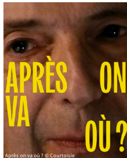
Après on va où?