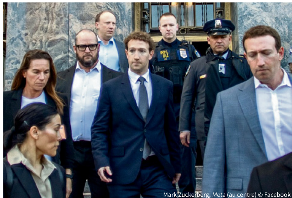
Mark Zuckerberg, Meta (au centre)

Nos gouvernements doivent se pencher sur ce problème moderne des plus préoccupants, comme ils l'ont