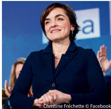
Christine Fréchette