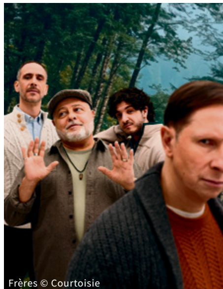
Frères