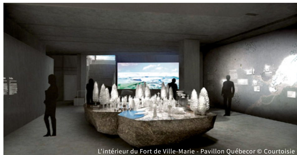
L'intérieur du Fort de Ville-Marie - Pavillon Québecor

Tout aussi fascinante est la visite, accessible à l'année longue, d'une portion de 110 mètres du premier égout collecteur érigé en Amérique du Nord. 4 ans furent nécessaires pour construire cet ouvrage qui à l'époque constituait une réelle avancée en matière d'ingénierie civile. Les travaux furent terminés au courant de 1838. Située en dessous du musée Point-à-Callière, cette portion