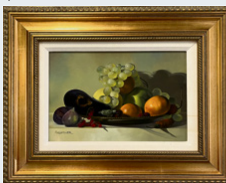
ARNOLD TOUBEIX Nature morte sur bois, 14" x 9.5". Valeur de 6000 $, seulement 1500 $.