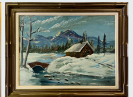
PAYSAGE QUÉBÉCOIS, 32" x 24". 100 $