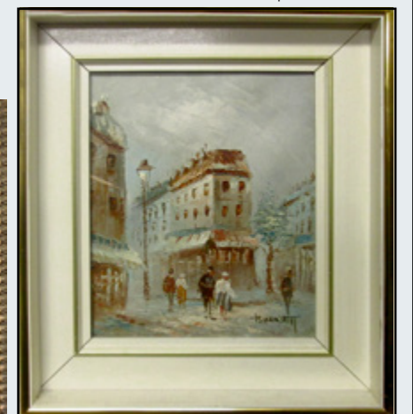
CAROLINE BURNETT Huile sur toile, 19 e , impressionniste, Scène de Paris, 8" x 10". 150 $.