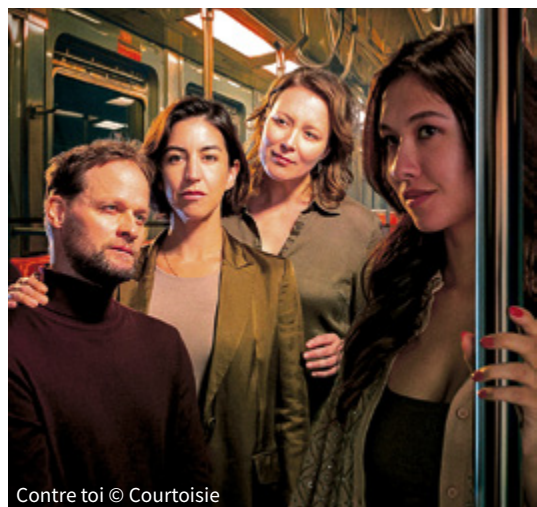
Contre toi

Tel qu'annoncé dans notre dernière édition, le nouveau texte du grand auteur Michel Marc Bouchard prend l'affiche ces jours-ci. Sa pièce Une fête d'enfants (14 janvier au 8 février, TNM) explore la perfection d'un couple homosexuel qui éclate en morceaux après qu'un geste, pourtant maintes fois répété, ait été surpris par l'une de leurs filles. On voue l'avoue: on compte les nuits avant d'assister à la première.