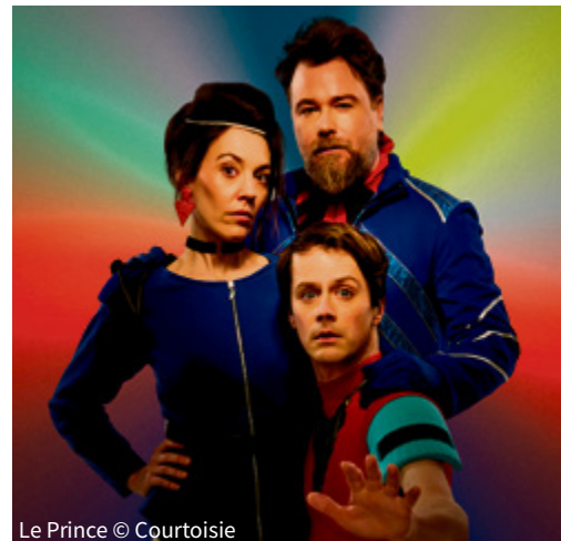
Le Prince